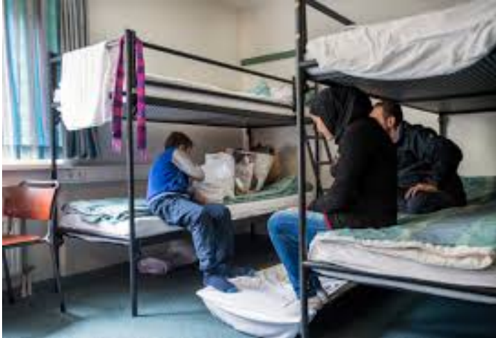
Foto 4: Wat vind jij van de opvang in Nederland? Wat is goed en wat niet?