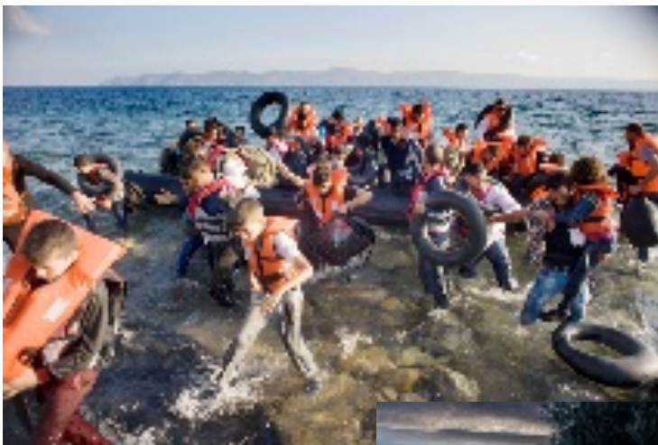
Foto 2 + 3: Wat vind jij van de omstandigheden voor vluchtelingen in Lesbos? Moeten we hier iets aan doen of niet?