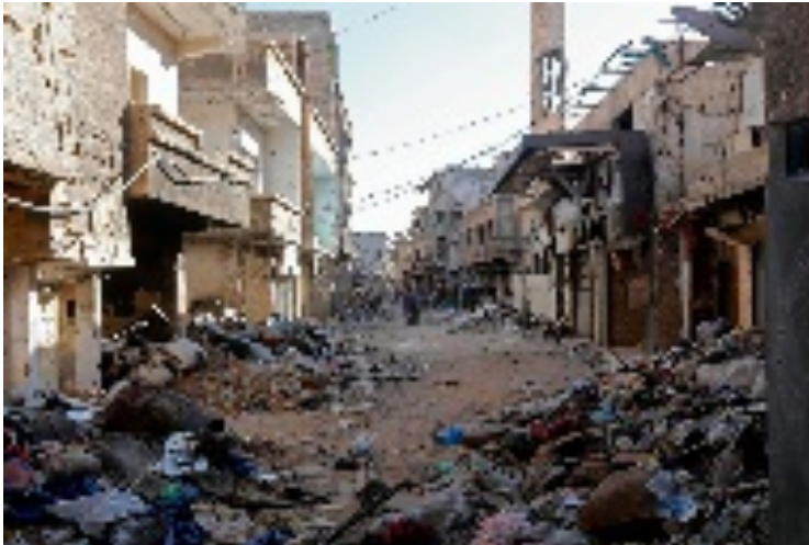
Foto 1: Hoe zou het zijn als jij in de schoenen van Fajer zou staan?